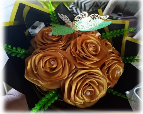
Ramo de rosas eternas