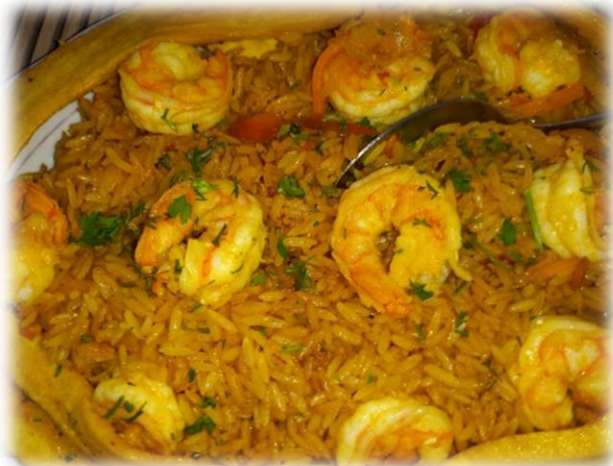
Arroz con camarones