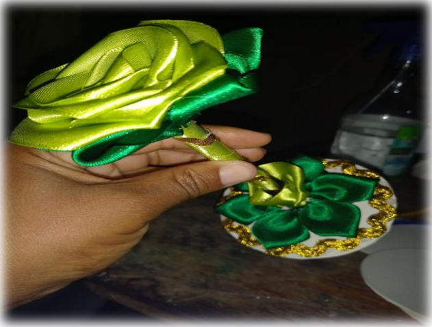
Lapicero en rosa eterna