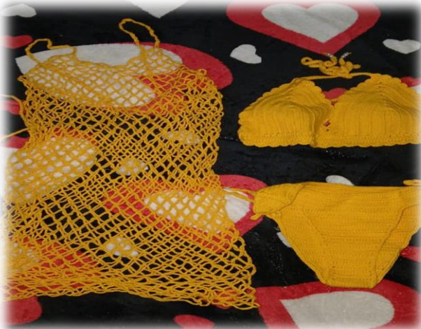
Traje de baño