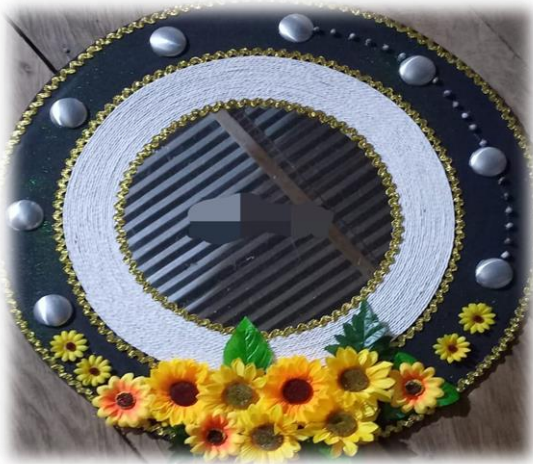
Espejos con fique de arroz y material reciclable Espejo con semillas de asai